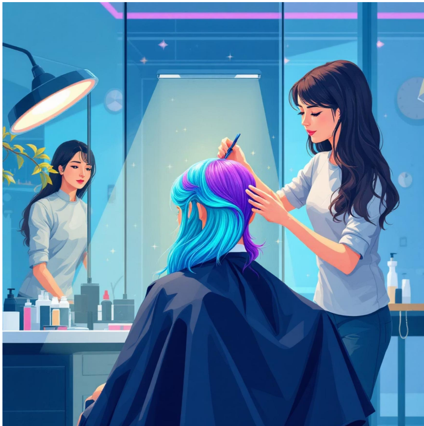
Колористика та Колірне Вирішення